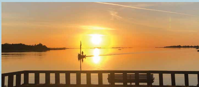
Skipper på vej i havn i solnedgang over Kleven.

Beboerhuset er et tidligere missionshus. Det er nu drevet af Ommel & Omegns Beboerforening, der har over 250 husstandsmedlemmer.