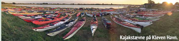
Kajakstævne på Kleven Havn.