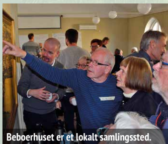
Beboerhuset er et lokalt samlingssted.

Strandbyen Havn arbejder på at bibeholde det hyggelige havnemiljø, men også på at fremtidssikre sig i form af udbygning af sejlbredde og etablering af en mole. Ligeledes arbejder vi på at skabe bedre mulighed for, at også teltligere kan nyde den flotte udsigt og det unikke miljø. Autocampere er en turistform i vækst, så de får en ny større placering på havnen.