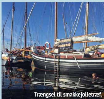
Trængsel til smakkejolletræf.

Skt. Hans bål ved Kleven Havn byder sommeren velkommen med et stort bål med både heks og båltale. Flagforeningen sørger for telt, bar med drikke, grill med pølser samt 'løwtens pankar' (tykke pandekager).