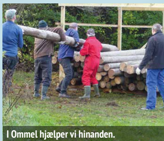
I Ommel hjælper vi hinanden.

Ommel Boldklub har et herresenior fodboldhold, der spiller på banerne på Marstalsvejen. Ærø Hundeklub bruger også plænerne til hundetræning.