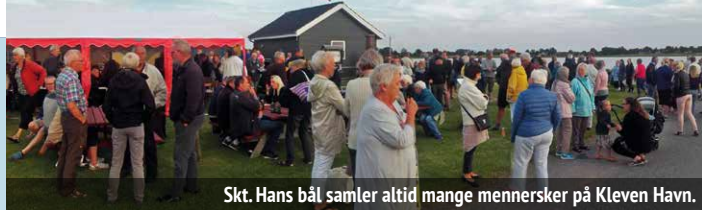
Skt. Hans bål samler altid mange mennersker på Kleven Havn.