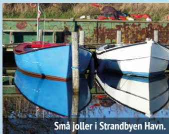
Små joller i Strandbyen Havn.

Husene i Ommel er ofte små, beliggende på en lille grund og bygget sammen med nabohuset. De stammer fra dengang, hvor mænd sejlede på langfart, og kvinder var alene med børnene, så der hverken var tid eller råd til store huse med haver. Mange af husenes karakteristika er velbevarede, selv om de er moderniseret.