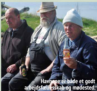
Havnene er både et godt arbejdsfællesskab og mødested.

Ommel Samvirke er stedet hvor tingene koordineres, men også en platform der løbende arbejder med initiativer, der kan gøre Ommel til en levende bæredygtig landsby. Vi arbejder løbende på at forbedre trafikken i byen og den offentlige transport, opsætte bænke i byen og i landskabet, holde velkomstarrangementer for tilflyttere, afholde politikermøder og meget mere. Her er nye ideer og initiativer altid meget velkommen.