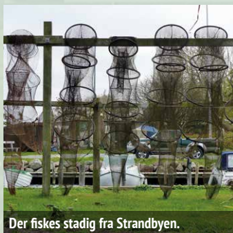
Der fiskes stadig fra Strandbyen.

Der er en positiv udvikling i hussalget, hvor husene ikke ligger længe, før 'SOLGT' skiltet erstatter 'TIL SALG'. Tilflytningen er for den overvejende del familier med helårstilknudning til Ærø. Det forpligter, og vi arbejder på flere tiltag både omkring beboerhuset og havnene samt en bedre tilflytter- og turistservice.