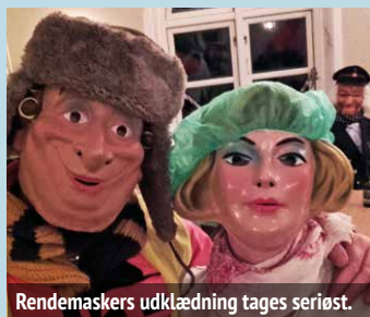
Rennemaskers udklædning tages seriøst.

Fastelavn for børn der slår katten af tønden i beboerhuset, hvor forældre, familie og venner er meget velkommen.