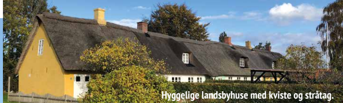
Hyggelige landsbyhuse med kviste og stråtag.