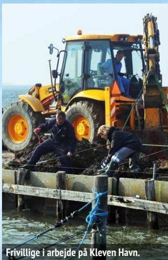
Frivillige i arbejde på Kleven Havn.

Ommel er en unik 'rund' landsby, hvor man siger 'pas på du ikke farer vild' til turisterne. Selv om man ikke overnatter her, skal især vandrere og cykelturister lade ruten gå omkring Ommel. I kan nyde stemningen ved Strandbyen Havn og beundre solnedgangen på Kleven Havn eller helt ude på Ommelshoved.